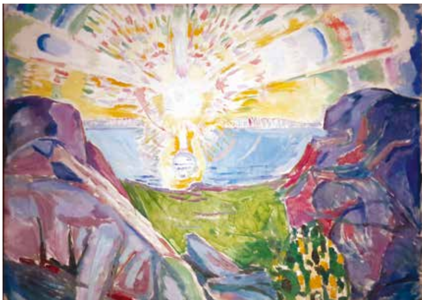
Edvard Munch, «Die Sonne», 1910–1913, Barberini Museum, Potsdam.

Samstag, 30. März, 23.30 Uhr, bis Sonntag, 31. März, 0.30 Uhr