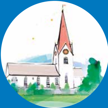
KIRCHE HÖNGG Am Wettingertobel 40 8049 Zürich