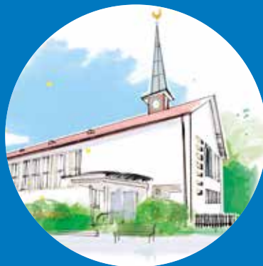
KIRCHGEMEINDEHAUS OBERENGSTRINGEN Goldschmiedstrasse 8 8102 Oberengstringen