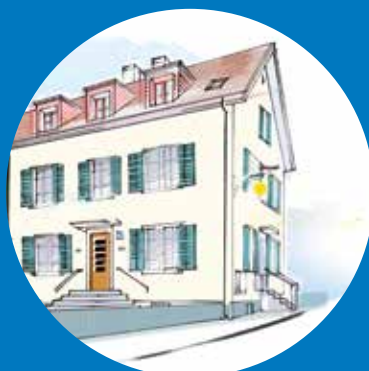
SONNEGG FAMILIEN- UND GENERATIONENHAUS Bauherrenstrasse 53 8049 Zürich