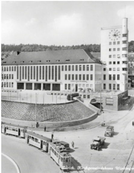
Entsteht hier das neue Haus der Diakonie?