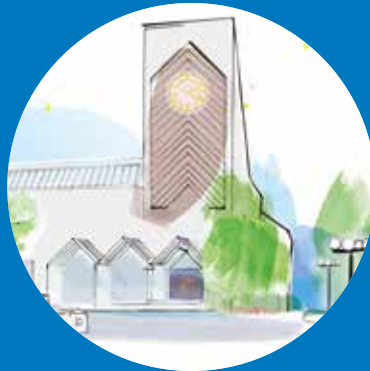
KIRCHE OBERENGSTRINGEN Goldschmiedstrasse 7 8102 Oberengstringen