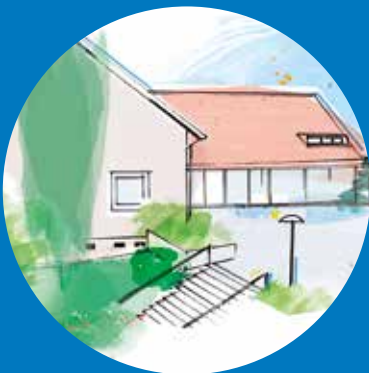
KIRCHGEMEINDEHAUS HÖNGG Ackersteinstrasse 190 8049 Zürich