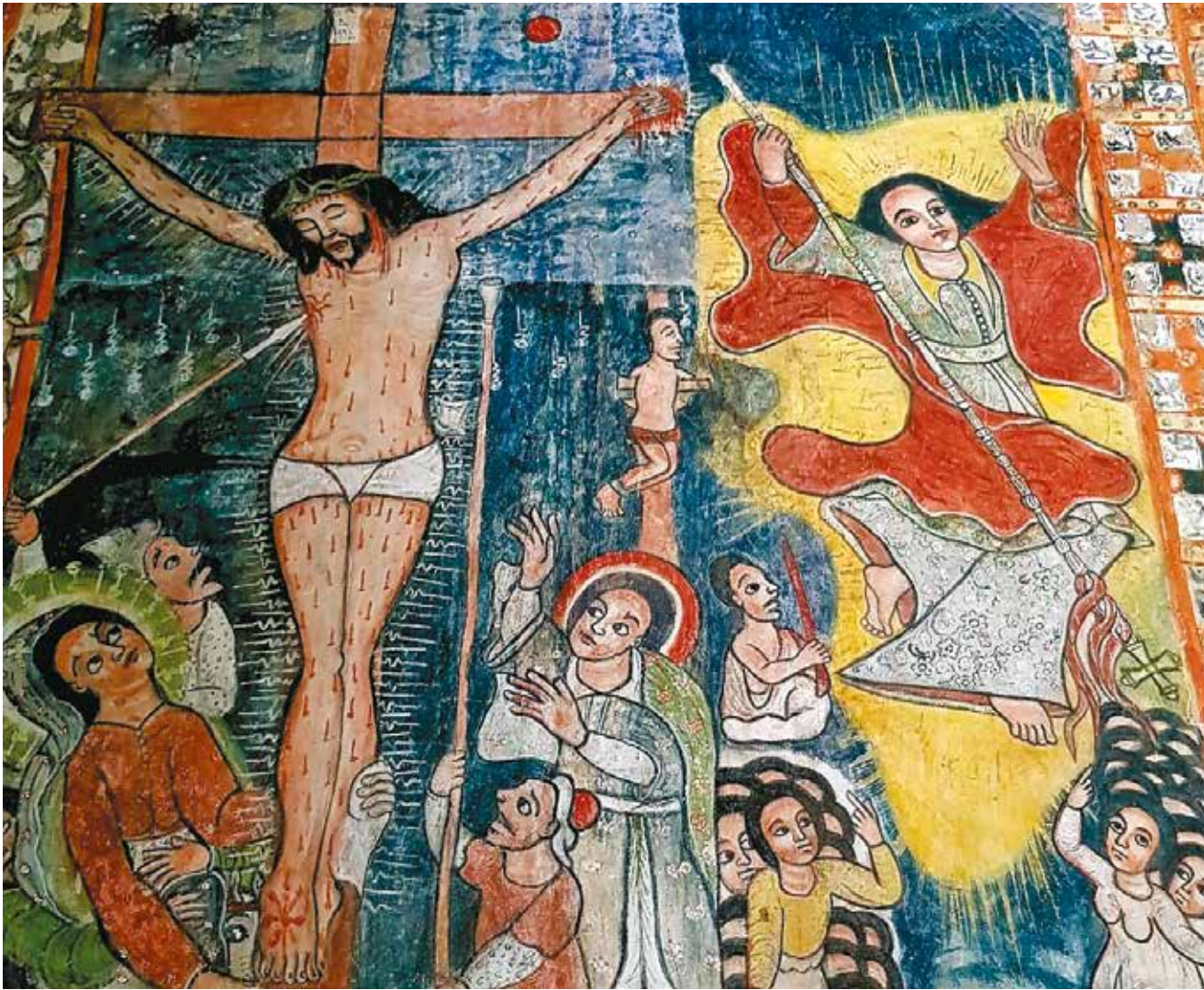
Fresko in der Kirche Narga Selassie auf der Insel Dek im Tana See, Äthiopien.

Mutter? Was für eine Hautfarbe hätte er? Was wäre sein Geschlecht? Wer wären ihre/seine Jüngerinnen und Jünger? Wer bedarf heute dringend der Erlösung? Wen hätte sie/er zum Feind und wodurch würde sie/er den Tod finden?