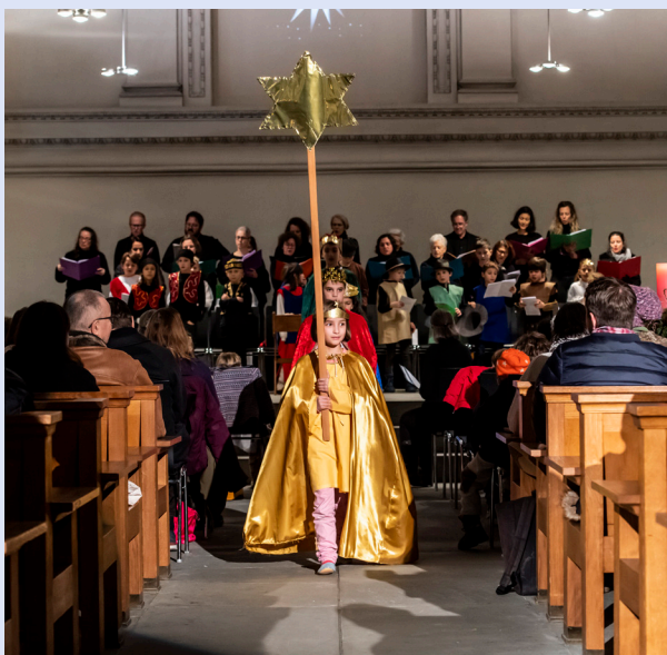
Impression vom Weihnachtsspiel 2022 in der Predigerkirche, begleitet von einer Singgemeinschaft von Kindern und Erwachsenen.