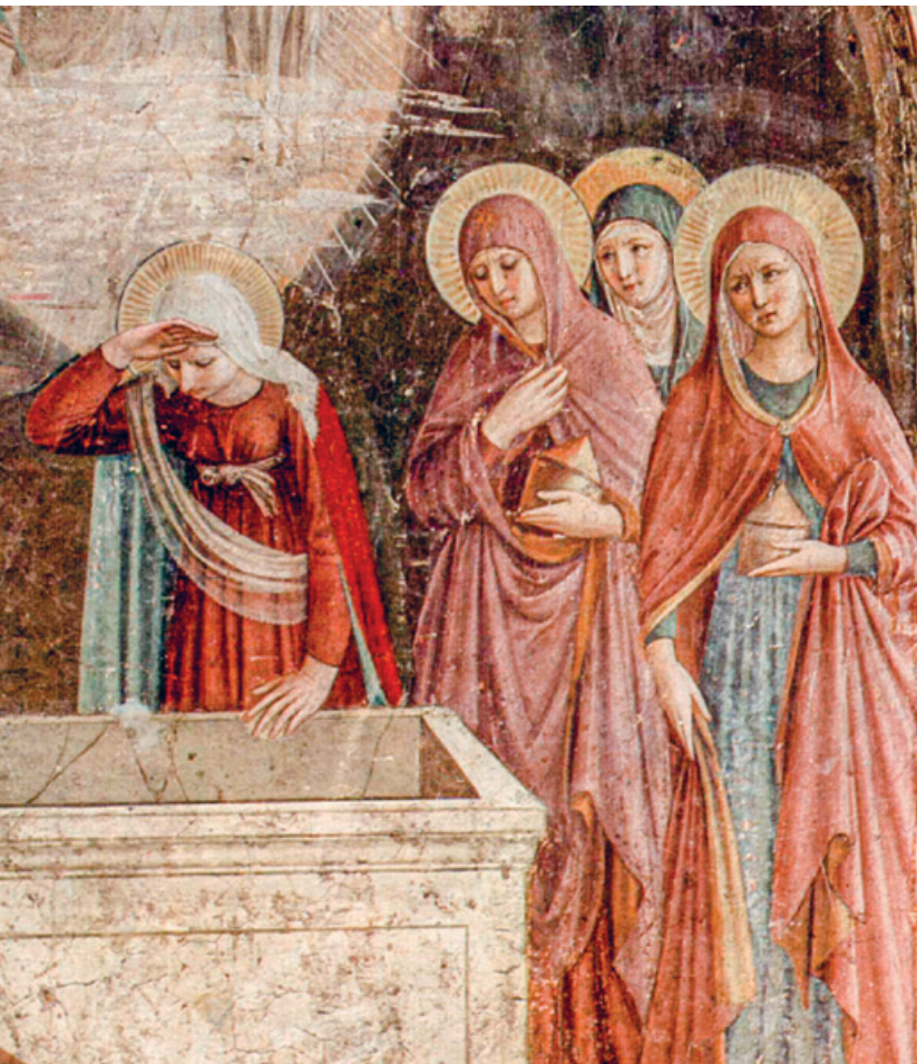
Jesus im Kloster San Marco in Florenz.

Jüngerinnen folgten, liessen ihr bisheriges Leben, in dem sie gefesselt waren in vielfältigen Gewohnheiten, Gleichgültigkeit, Pflichterfüllung, vielleicht auch Resignation, Orientierungslosigkeit oder gar Zynismus, zurück und brachen in ein neues, befreites Leben auf. Nachdenken und Gespräche über Gott und wie es mit unserem Leben als Menschen eigentlich gemeint sei, gehörten dazu. Hinsehen und Beistehen, wo immer es nötig war; Hoffnung und Freude. Eine ungeahnte Lebendigkeit.