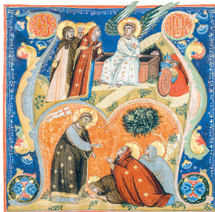
Illustration von Nerius 1320.