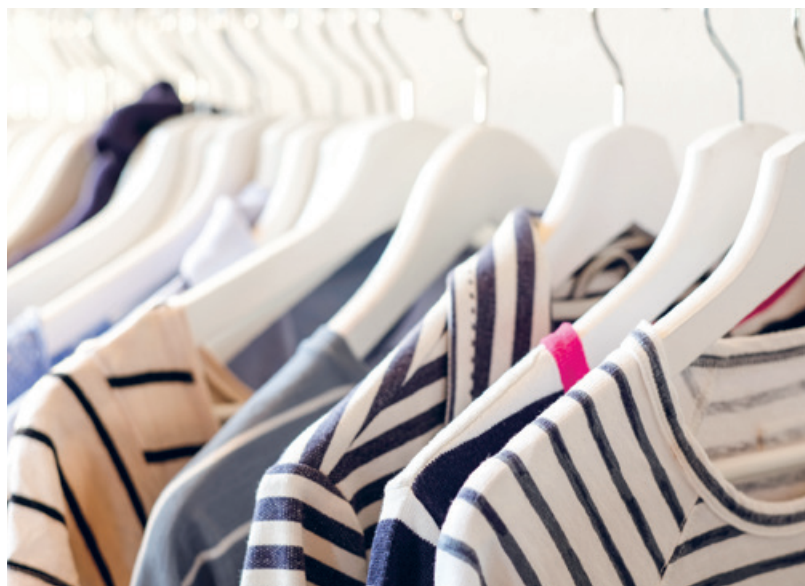
Offener Kleiderschrank.