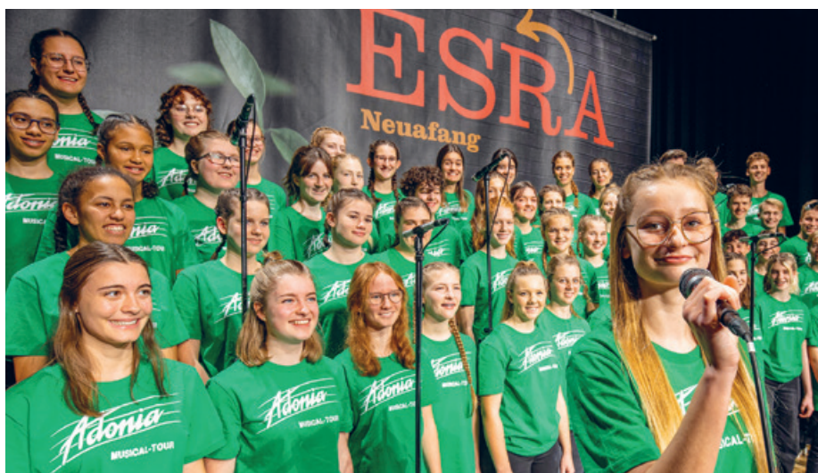
Adonia-Chor mit Solistin.

KIRCHENZENTRUM LEIMBACH Samstag, 29. April, 20 Uhr