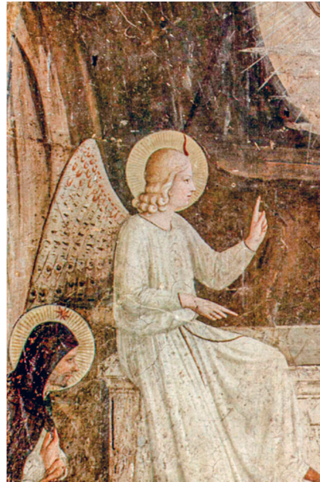
Fra Angelicos «Die Drei Marien am Grabe Christi», Fresken