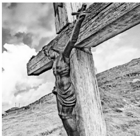
Am Klausenpass.