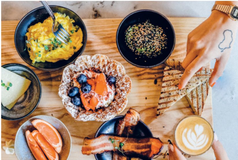
Austauschen und zusammen geniessen: Am Brunch mit Teilete.

Im April letzten Jahres haben wir unsere kleine, aber feine Kleiderboutique mit Secondhandmode eröffnet. Seither ist einiges geschehen.