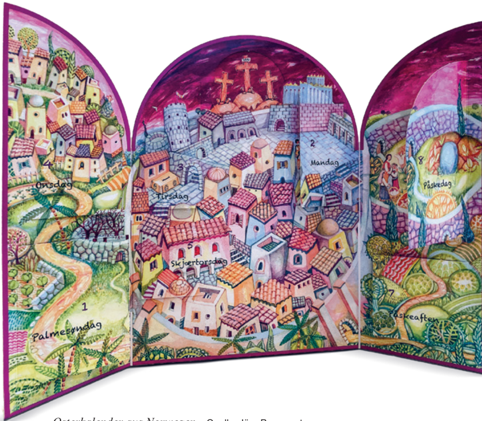
Osterkalender aus Norwegen.

«Das zentrale Geheimnis des christlichen Glaubens liegt in der wundersamen Verwandlung von Leid, Schmerz und tödlicher Resignation in neue Hoffnung, lebendige Zuversicht und Lebensfreude.»