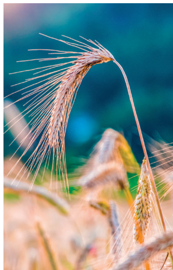
Träume von Ähren für alle.

Workshop jeweils Mittwoch, 10., 17., 24. und 31. Mai, 19–22 Uhr, Kirchengemeindehaus Bederstrasse und Kirche Enge