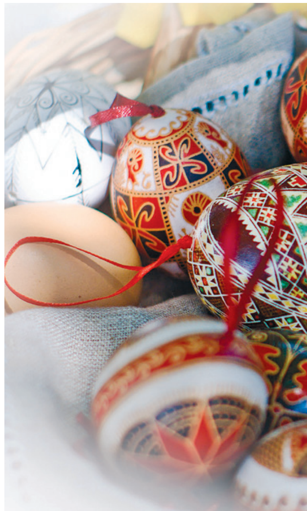
Ukrainische Ostereier.