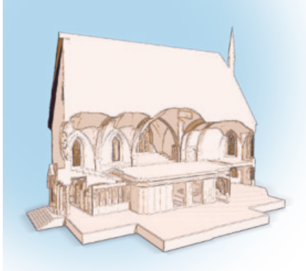
Alle Umbauten nehmen grosse Rücksicht auf den baulichen Charakter der Kirche.

Die Kirche Wipkingen wird zum Betreuungsraum für die Schulanlage Waidhalde: Das bedingt einen Umbau. Die Stadt Zürich und die reformierte Kirchgemeinde schrieben deshalb einen Architekturwettbewerb aus. Nun steht das Gewinnerteam fest.