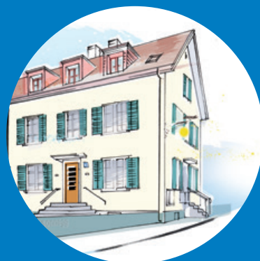
SONNEGG FAMILIEN- UND GENERATIONENHAUS Bauherrenstrasse 53 8049 Zürich