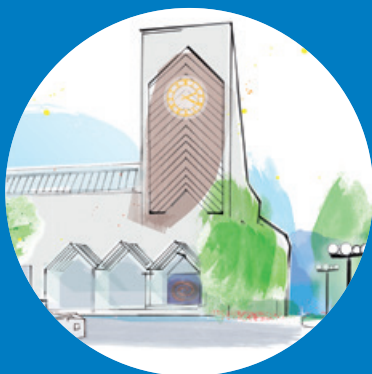
KIRCHE OBERENGSTRINGEN Goldschmiedstrasse 7 8102 Oberengstringen