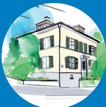
WIPWEST HUUS Hönggerstrasse 76 8037 Zürich