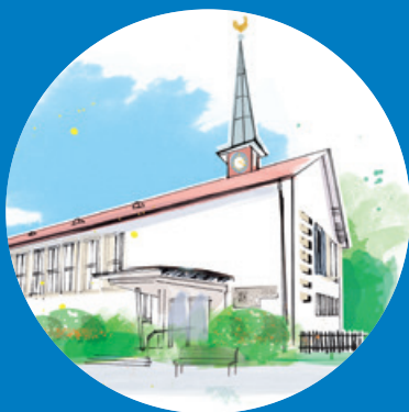
KIRCHGEMEINDEHAUS OBERENGSTRINGEN Goldschmiedstrasse 8 8102 Oberengstringen