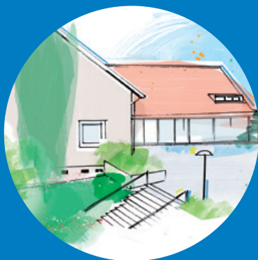
KIRCHGEMEINDEHAUS HÖNGG Ackersteinstrasse 190 8049 Zürich