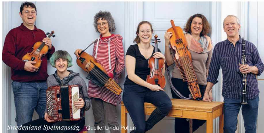
Swedenland Spelmanslag.

Tanzen, schwedische und balfolk-Musik erleben, Kinderspielraum, gemeinsames Buffet... wir laden ein zu einem weiteren «Bal» am Sonntag, 2. April!