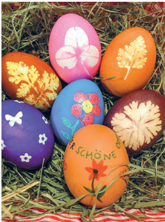
Ostereier aus Oberengstringen.

An diesem kreativen Nachmittag können wir voneinander neue Techniken lernen und Neues ausprobieren. Zum Färben stellen wir Zwiebel- und verschiedene Hölzersude sowie Eierfarben bereit.