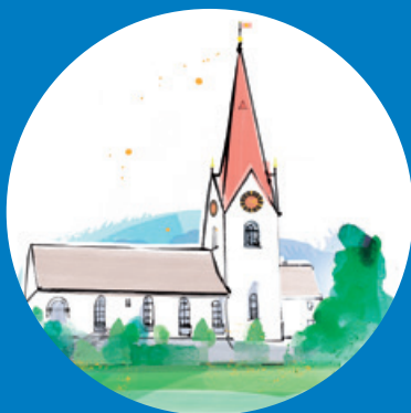
KIRCHE HÖNGG Am Wettingertobel 40 8049 Zürich