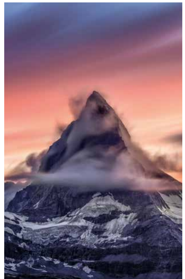
Wahrzeichen der Schweiz.