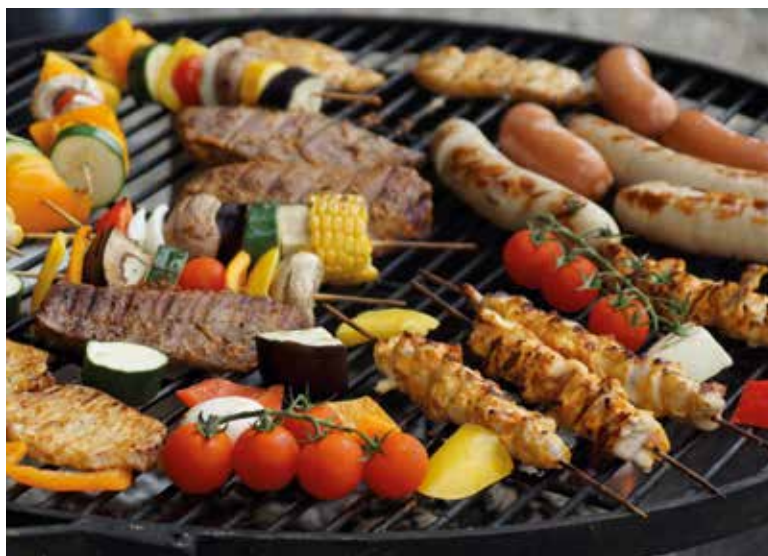
Lasst es euch schmecken.

Mi, 31. August 9-11 h oder 14-16 h Gedächtnistraining Silvia Suter, 079 270 31 70 KGH Oerlikon