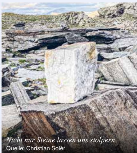
Nicht nur Steine lassen uns stolpern...