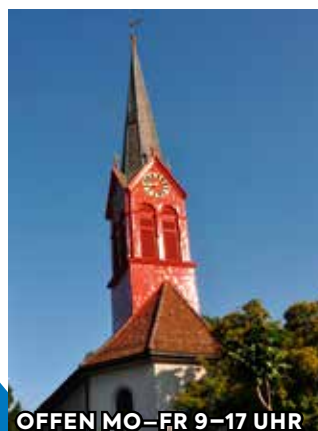
OFFEN MO-FR 9-17 UHR