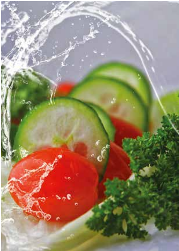
Ein knackiger Salat passt immer.