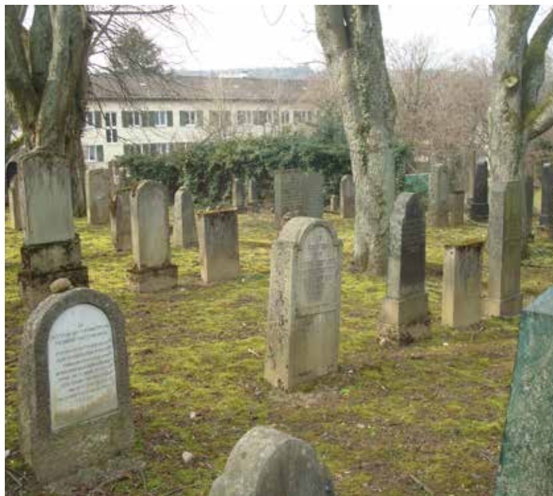
Jüdischer Friedhof Steinkluppe.