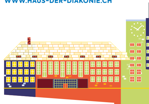
Leuchtturmprojekt: Haus der Diakonie.

INFORMATIONEN ZUM HAUS DER DIAKONIE UND DEN FOKUSGRUPPEN: WWW.HAUS-DER-DIAKONIE.CH