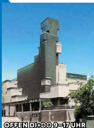
OFFEN DI+DO 9-17 UHR