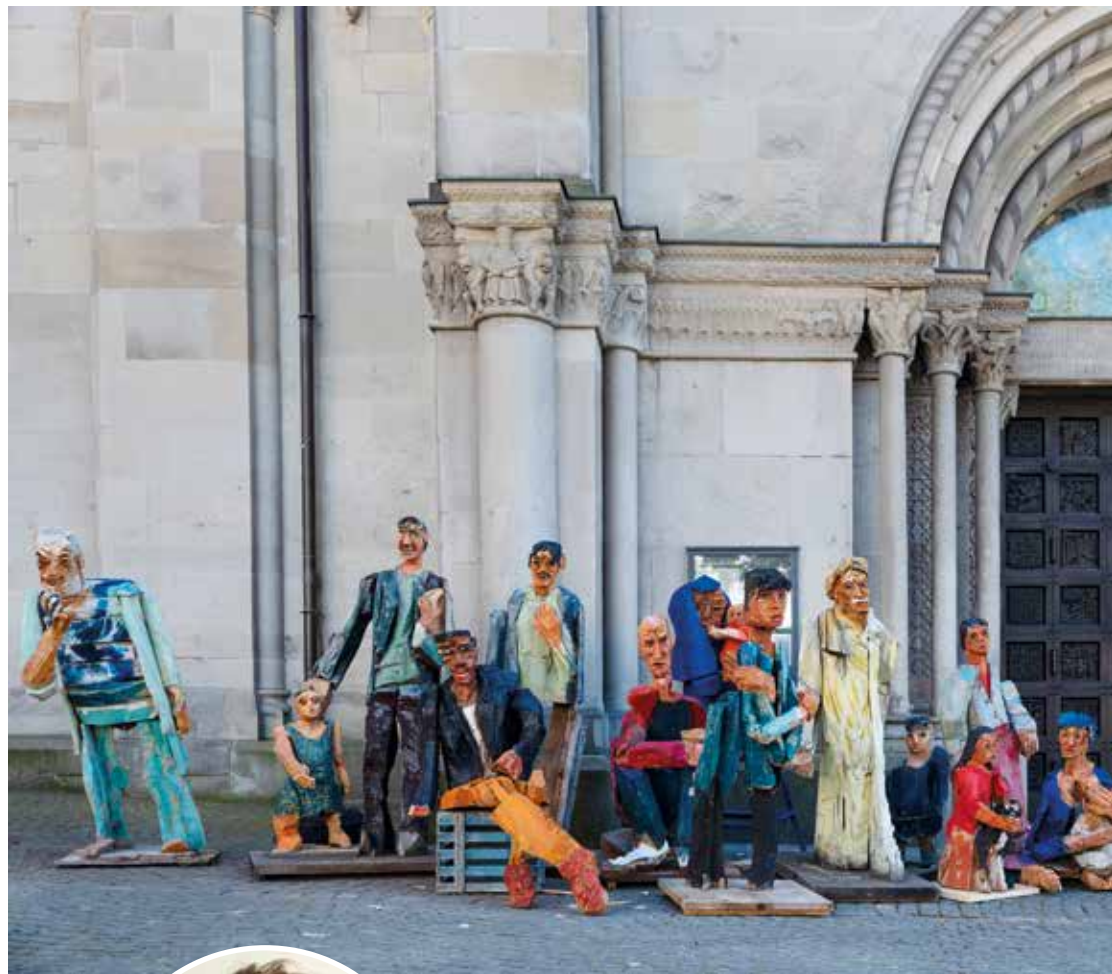
Die Ausstellung «entwurzelt & ausgeliefert» zeigt H