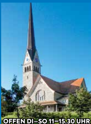
OFFEN DI-SO 11-15.30 UHR