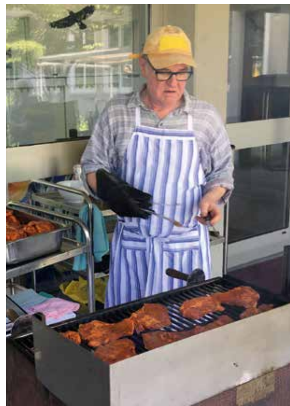
Brätlen für den Zmittag für alle.

Sonntag, 21. August, 10 Uhr Gottesdienst mit Verabschiedung von Urs Gander