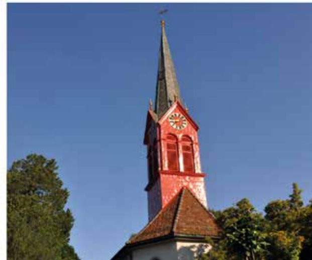
Unsere vier Kirchenstandorte.