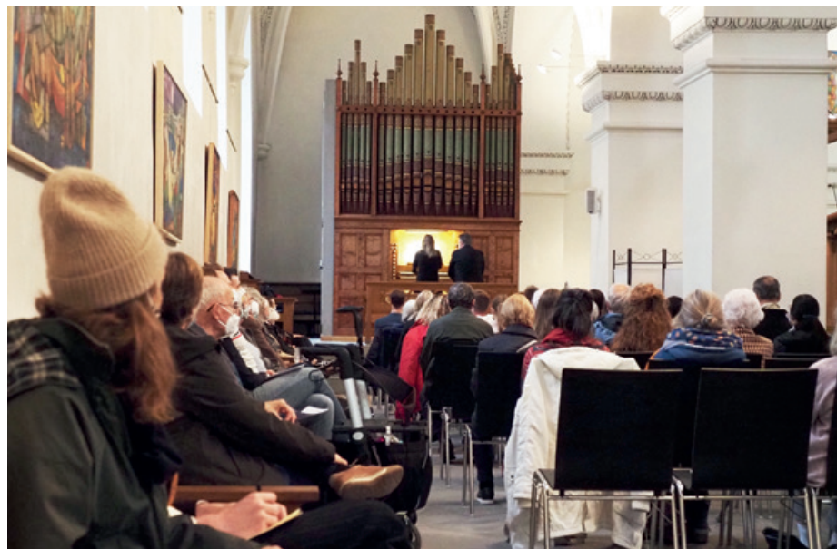
Stillechte englische Tea-Time-Konzerte auf der Conacherorgel.

Im Verein engagieren sich Menschen, die die Predigerkirche als Ort der Gastlichkeit, Ökumene, Spiritualität und des Experimentierfeldes kirchlichen Lebens fördern und unterstützen möchten. Der Verein ist offen für alle Interessierten, unabhängig von Konfession oder Tradition, und möchte vor allem dazu beitragen, dass sich Menschen mit Körper, Geist und Seele in der Predigerkirche beheimatet fühlen. Die Zusammenarbeit mit den geistlich und seelsorglich Verantwortlichen, der reformierten Pfarrerin und dem katholischen Seelsorger, wird sehr gepflegt und beide sind Mitglieder des Vorstands. Die konfessionelle und interreligiöse Offenheit der Predigerkirche kommt im regen Zuspruch zu den überkonfessionell gestalteten, liturgischen Feiern (Gottesdienste, Morgenmeditation oder Mittagsgebet), der Freitagsvesper, regelmässigen Ritualfeiern im Jahreskreis, Segnungs- und Salbungsgottesdiensten oder dem Labyrinth in der Adventszeit zum Ausdruck. Anlässe zu Themenschwerpunkten, wie «Multikonfessionalität» oder «Mystik in der Predigerkirche», Kunstausstellungen und Konzerte (z.B. Tea Time Concerts) finden grossen Anklang. Die Vereinsausflüge, die im Spätsommer durchgeführt wurden, haben uns zum Kloster Fahr und zur Insel Ufnau geführt.