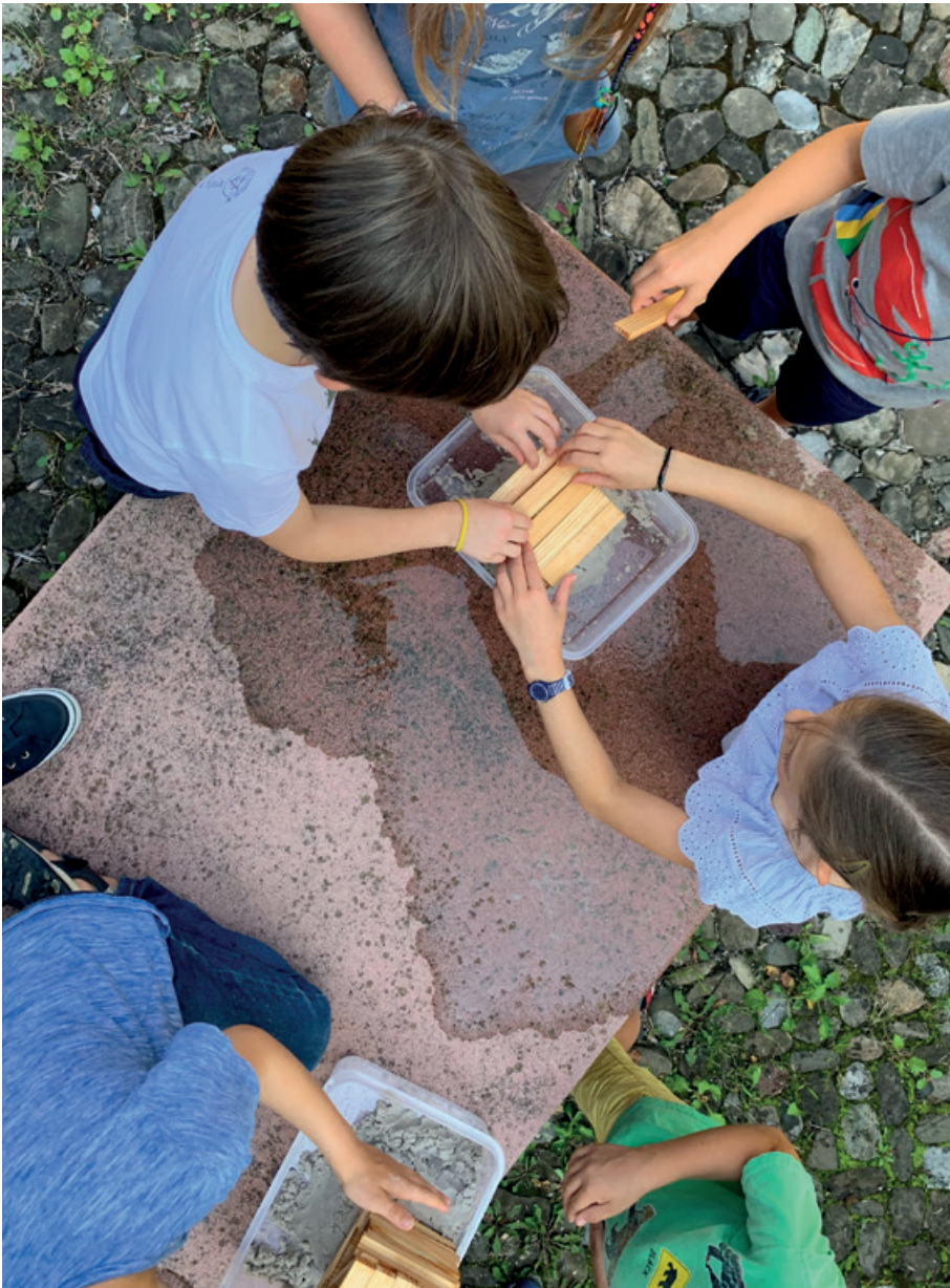
Die Bibel im Religionsunterricht hautnah erleben – das Gleichnis vom Hausbau.