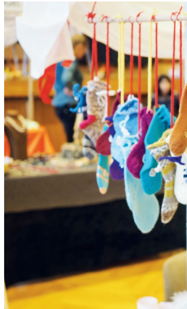
Adventskalender im Angebot.