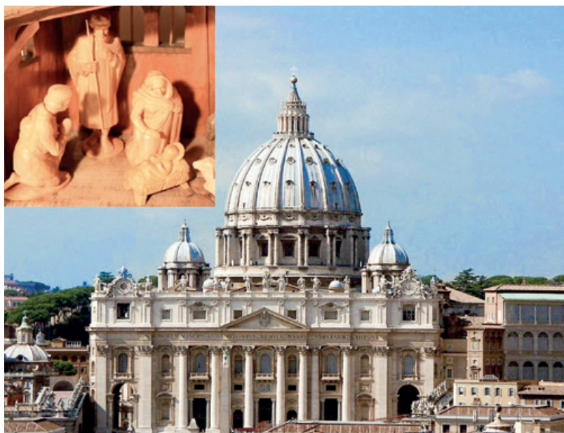
Vom Stall zum Dom.