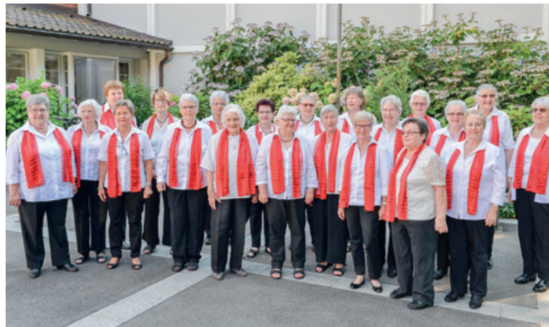
Frauenchor Wipkingen.