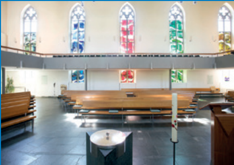
Die Kirchenfenster.

Wenn Sie in der Kirche Unterstrass sitzen, dann sehen Sie vorne die Fenster von Franz K. Opitz von 1965. Es sind figürliche Darstellungen mit biblischen Motiven. Wenn Sie sich umdrehen, sehen Sie Fenster in einem ganz anderen Stil vom selben Künstler. Sie tragen den Titel «Durchdringung» und wurden 1997 eingeweiht.