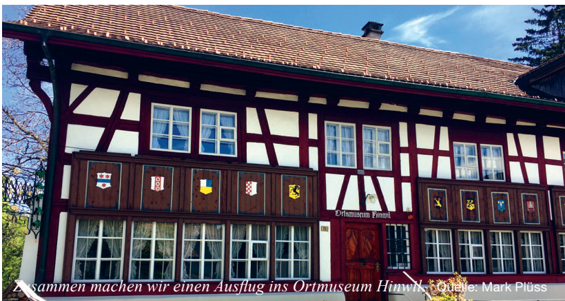
Zusammen machen wir einen Ausflug ins Ortsmuseum Hinwil.