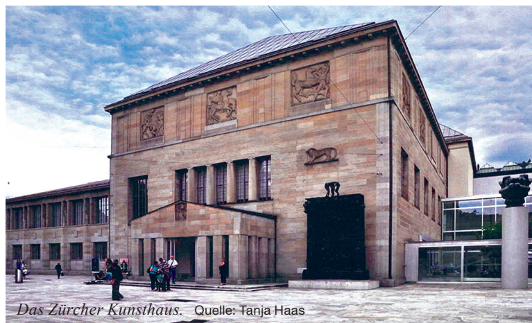
Das Zürcher Kunsthaus.

Marco Mühlheim Neue Kirche Albisrieden Graues Zimmer