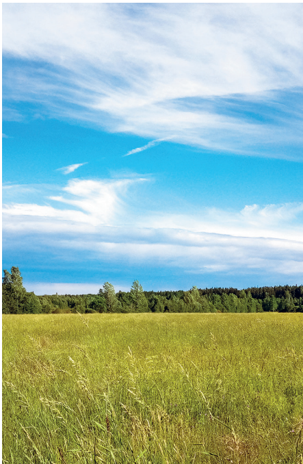
Zwischen Himmel und Erde.