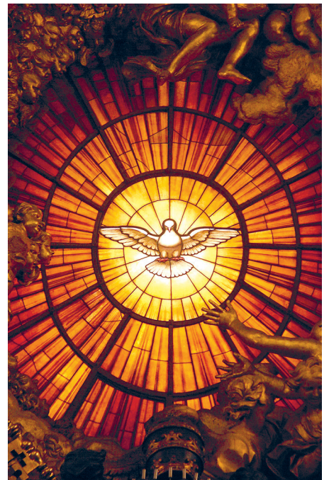
Fenster in Rom.