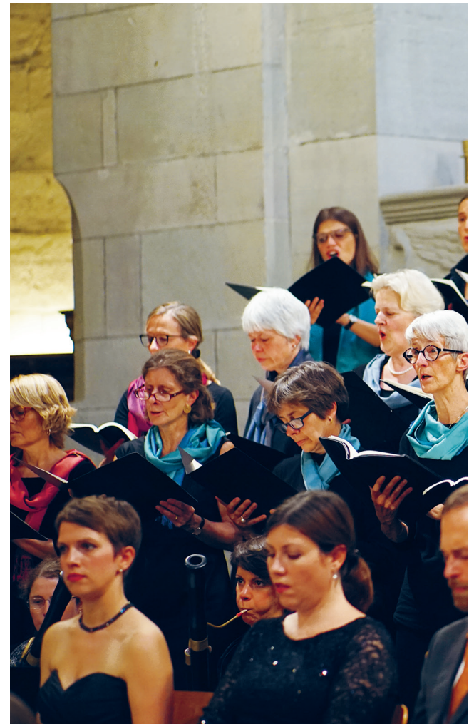
Konzert im Grossmünster.

Musik als universelle Sprache ist aus dem kirchlichen Leben nicht mehr wegzudenken. Gemeinsames Singen fördert zudem den Gemeinsinn – die Sozialwissenschaft kann das belegen. Auch die Reformatoren liessen sich von der Wirkung von Musik verzaubern.