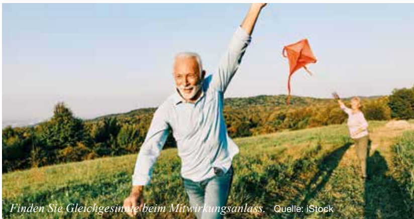
Finden Sie Gleichgesinnte beim Mitwirkungsanlass.