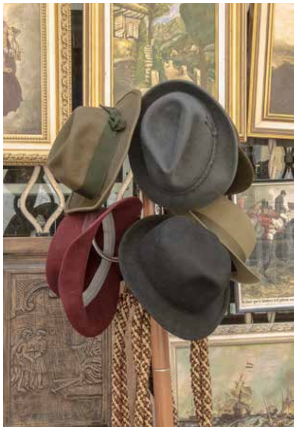
Hüte, Bilder, Aufhänger... und mehr!