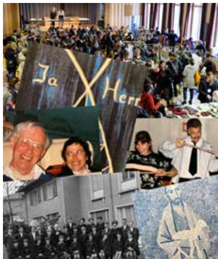
Viele Erinnerungen.

Im Kirchgemeindehaus Oerlikon wird sich Vieles ändern (siehe Artikel unten). Das weckt bei vielen Gemeindegliedern auch viele Erinnerungen: an die ganze