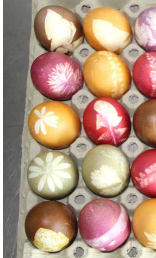
Eier mit Naturfarben und Liebe gefärbt.