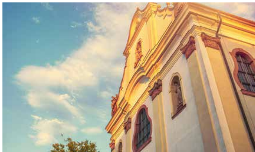
Katholische Kirche im Barock-Rokoko-Stil, Vác (Ungarn).