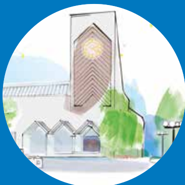
KIRCHE OBERENGSTRINGEN Goldschmiedstrasse 7 8102 Oberengstringen