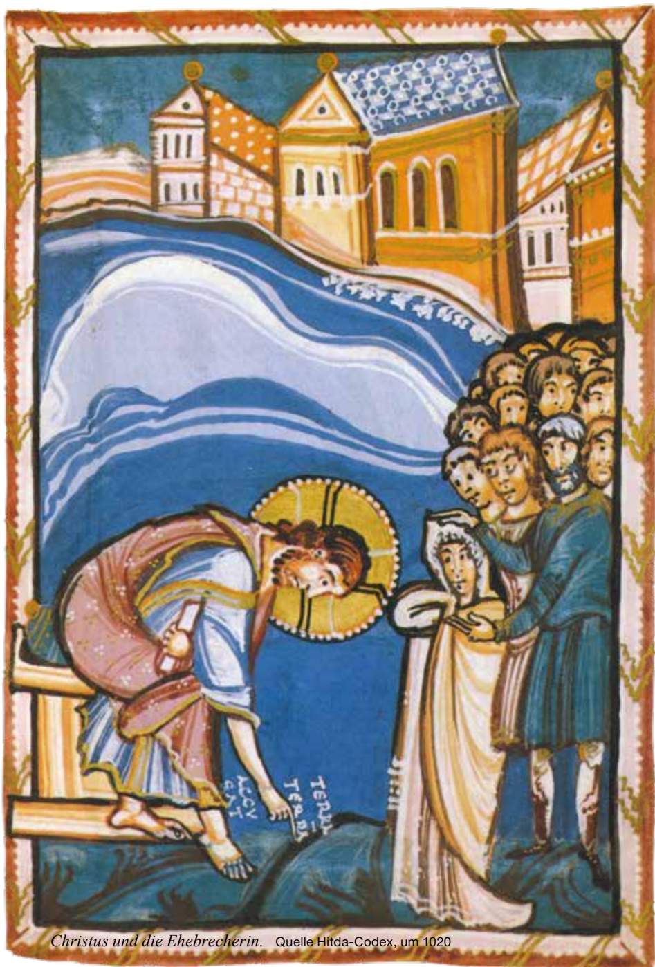
Christus und die Ehebrecherin.

spielt sich auf einer unbestimmbaren blauen Fläche ab. Im Hintergrund sind Gebäude erkennbar, auf deren exakte Räumlichkeit der Maler wenig Wert gelegt hat. Rechts drängt sich eine Menschenmenge dicht zusammen. Ein bärtiger Mann schiebt die hell gekleidete Frau nach vorne. Sie verbirgt die Hände scheu und schaut Jesus fragend an. In der einen Hand hält Jesus eine Schriftrolle und mit dem Zeigfinger der anderen Hand schreibt er die Worte «Terra terram accusat» – «Erde klagt Erde an» in den Sand.