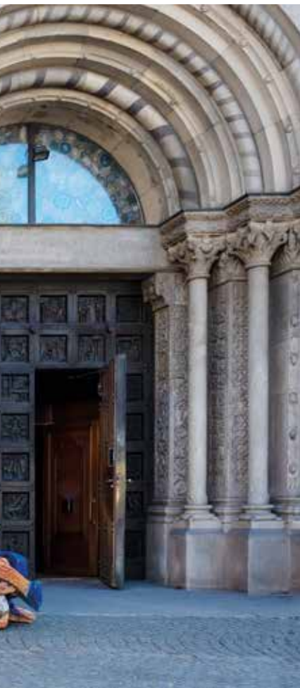
Polzskulpturen von geflüchteten Personen.