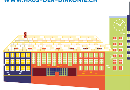
Leuchtturmprojekt: Haus der Diakonie.

INFORMATIONEN ZUM HAUS DER DIAKONIE UND DEN FOKUSGRUPPEN: WWW.HAUS-DER-DIAKONIE.CH