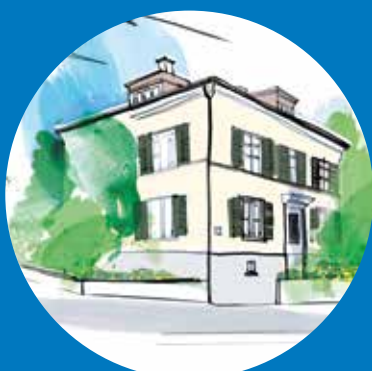
WIPWEST HUUS Hönggerstrasse 76 8037 Zürich