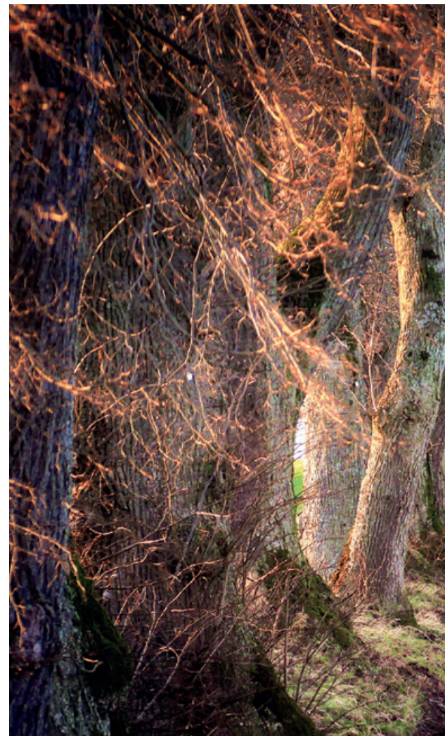
In den Letzte-Hilfe-Kursen lernt man den natürlichen Umgang

Erste Hilfe ist uns allen ein Begriff – und wir alle würden sie wohl ganz instinktiv leisten. Wenn es darum geht, Menschen in den Tod zu begleiten und uns dem Sterben zu stellen, macht sich eine grosse, bleierne Unsicherheit breit. Wie sollen wir der unausweichlichen Endlichkeit begegnen? Die reformierte Landeskirche Zürich bietet seit 2017 Letzte-Hilfe-Kurse an – und schafft damit einen Ort der Gemeinschaft am Angesicht des Todes.