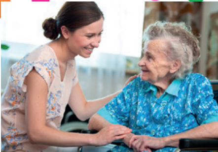
Va bene? Wie geht es Ihnen?

Der kostenlose Besuchsdienst va bene stellt aktiv Kontakte zwischen Menschen her. Freiwillige besuchen und unterstützen betagte Menschen. Dabei entstehen vertrauensvolle Beziehungen, die für beide Seiten so bereichernd wie wertvoll sind.