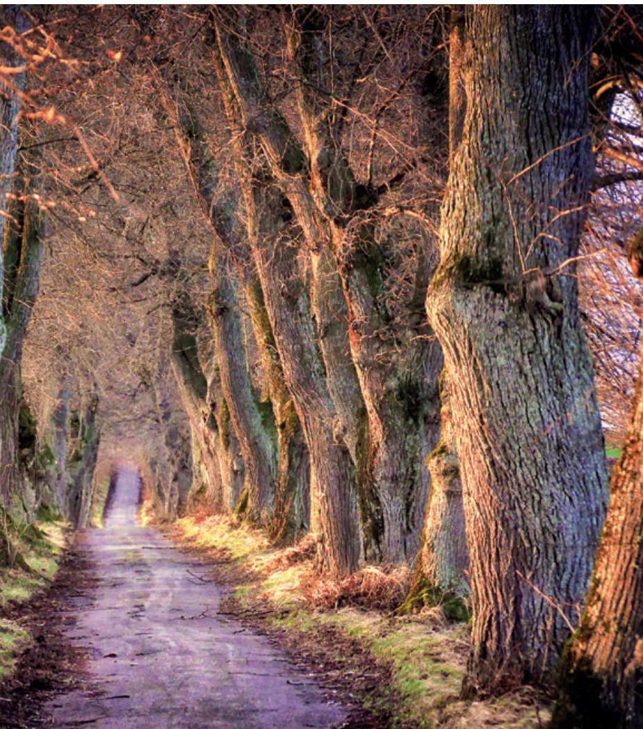
mit den Themen Sterben, Sterbebegleitung, Tod und Trauer.

Teil des Lebens anzunehmen. Dem Tod als Gemeinschaft zu begegnen und über die Unsicherheiten und Fragen, die er mit sich bringt, zu sprechen, kann helfen. Oft ist es auch der Glaube, der uns Halt gibt und uns Möglichkeiten zeigt, mit der Endlichkeit auf der Welt klarzukommen. Er unterstützt uns dabei, uns selbst zu verstehen und das Unausweichliche anzunehmen.