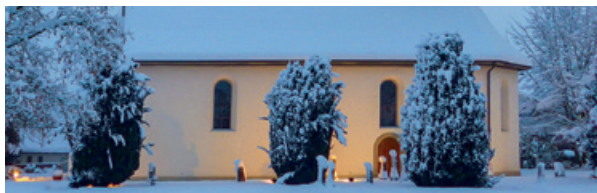
Welche Kirche sieht man hier?