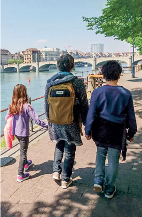
Familie Zryd im Aufbruch.

Die vergangenen drei Jahre in der ehemaligen Kirchgemeinde Albisrieden und im jetzigen Kirchenkreis neun waren eine kurze und prägende Zeit mit vielen Übergängen.