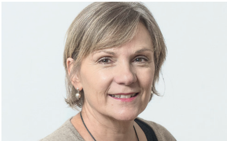
Monika Hänggi Hofer.

W elche Dinge möchten Sie unbedingt noch erledigen, bevor Sie sterben? Möchten Sie allein sterben oder im Kreis Ihnen nahestehender Personen? Wem möchten Sie vor Ihrem Tod noch Lebewohl sagen? Glauben Sie an das Jenseits? Empört Sie der Gedanke, endlich zu sein? Diese und viele andere Fragen werden in den Letzte-Hilfe-Kursen, die in vielen Kirchgemeinden mit Erfolg durchgeführt wurden, thematisiert und diskutiert. Die Kurse vermitteln, wie Angehörige, Freunde und Nachbarn nahestehende Menschen, die im Sterben liegen, begleiten und betreuen können. Ein Mix aus praktischen Hilfestellungen und Fragen über den «Sinn des Todes» und über eigene Sterbeerfahrungen macht den Teilnehmenden Mut, sich dem Thema zu stellen und die Begleitung der Nächsten im Angesicht des Todes nicht einfach Fachleuten aus dem Gesundheitsbereich zu überlassen.