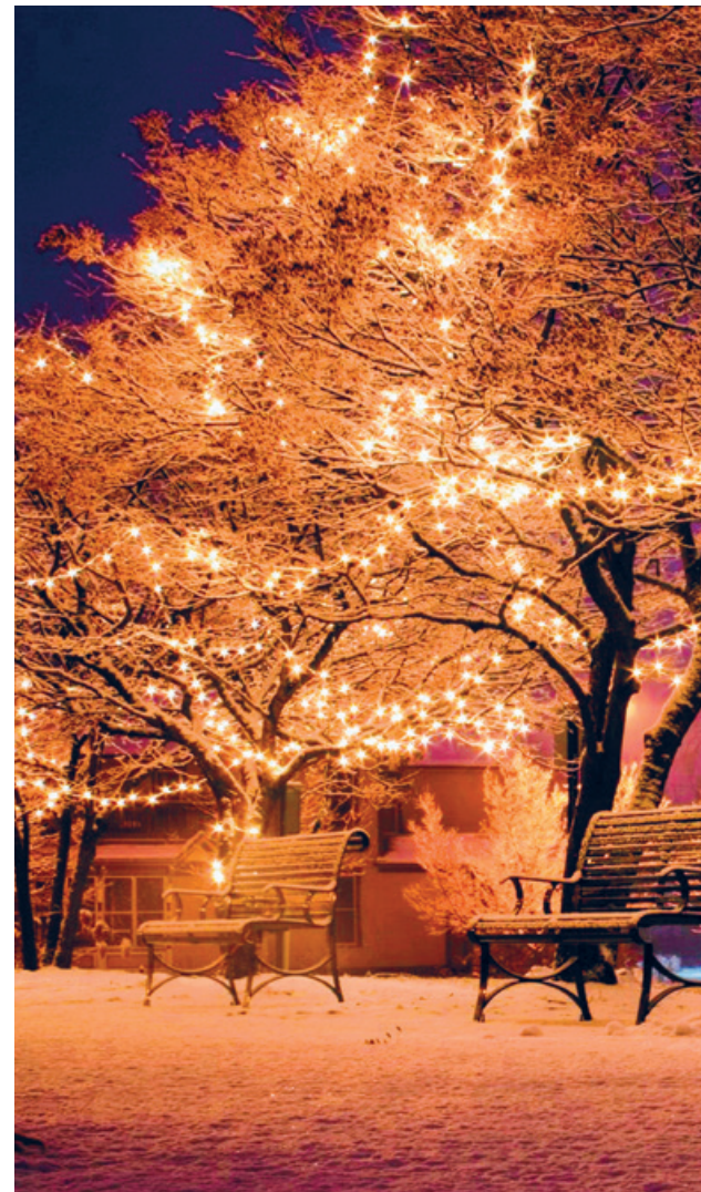
Während der Adventszeit werden dunkle Nächte durch die Weih

Ab Sonntag, 28. November bis 6. Januar während den Gottesdiensten und Anlässen, die in diesen Kirchen stattfinden