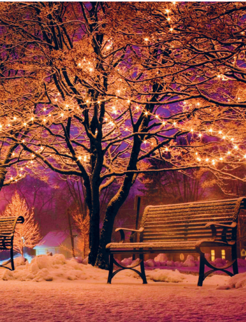
Nachtsbeleuchtung erhellt.

Weil Gott in tiefster Nacht erschienen, kann unsre Nacht nicht traurig sein! Bist du der eig'nen Rätsel müd? Es kommt, der alles kennt und sieht!