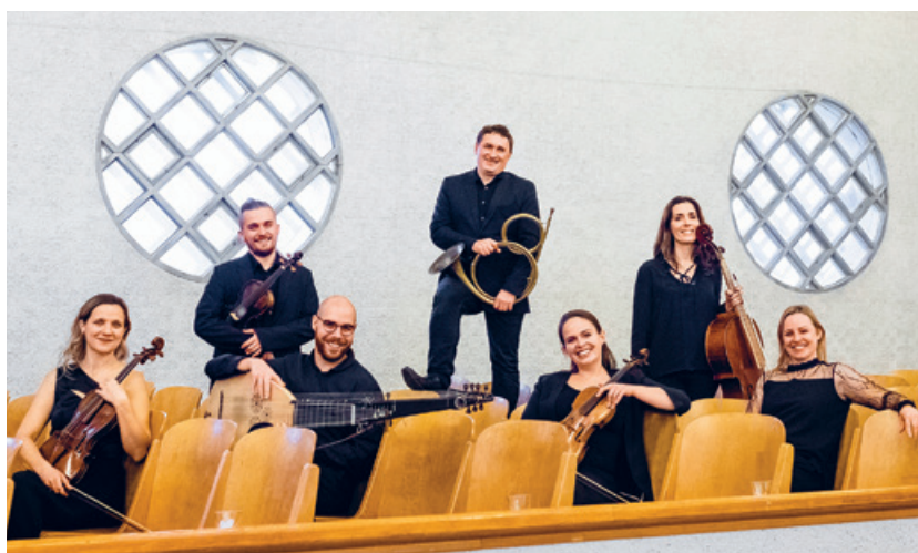
Das Yofin Barockensemble begeistert die Zuhörenden.