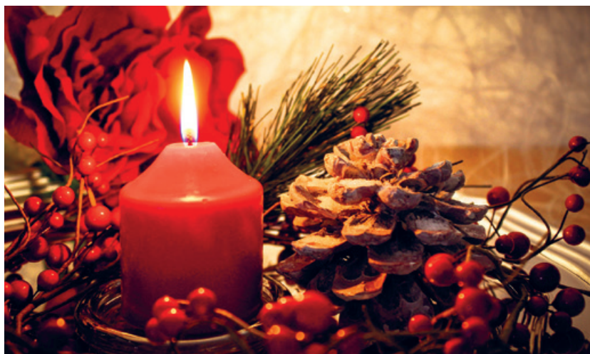
Festliche Adventsgestecke schmücken den Saal.