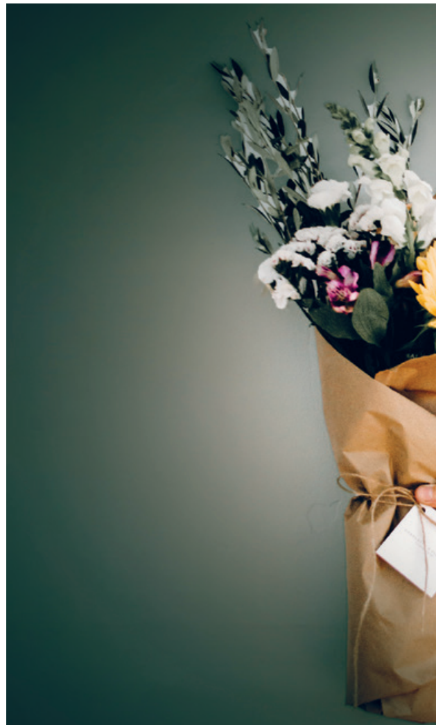
Sags mit Blumen, immer wieder und auch an Weihnachten.

Am 5. Dezember wird der Internationale Tag des freiwilligen Engagements gefeiert. Er fällt dieses Jahr auf den 2. Advent und provoziert die Frage: Wäre die Weihnachtsgeschichte ohne Freiwillige gut herausgekommen?