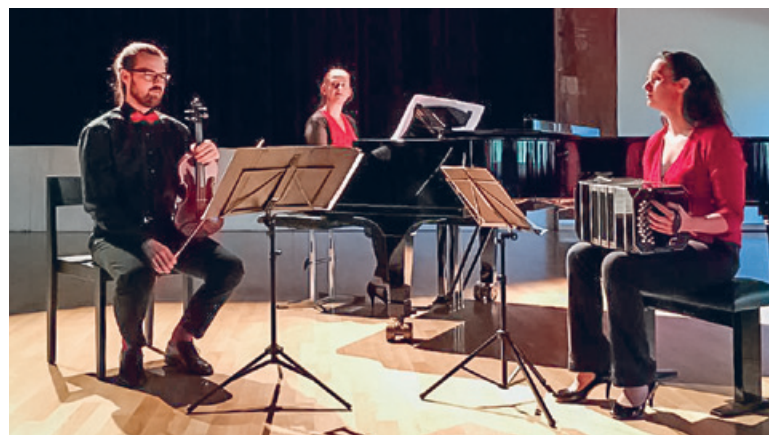
Trio Mefiso.