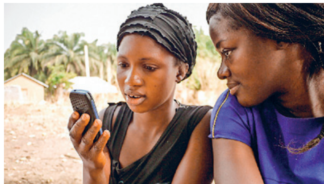
Ein wertvoller Besitz: das Handy.

KIRCHGEMEINDEHAUS OERLIKON Montag bis Freitag, 8.30–12 Uhr oder nach Vereinbarung