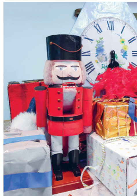
Der Nussknacker wartet auf seinen ersten Auftritt.