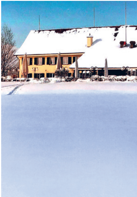
Pfannenstil Hochwacht.