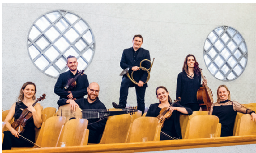
Das Yofin Barockensemble begeistert die Zuhörenden.