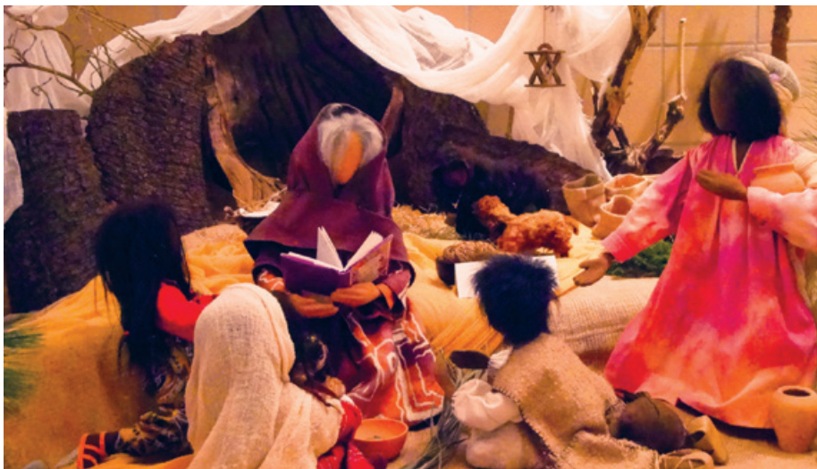
Krippenszene.

Weihnatskrippen haben eine lange Tradition: 1123 soll Franz von Assisi die Weihnatsgeschichte mit echten Tieren und Menschen nachgestellt haben. Für seine Darstellung wählte er eine Futterkrippe aus, die sich in einem Wald in der Nähe des Klosters Greccio befand. Er wollte gläubigen Menschen, die nicht lesen konnten, die Weihnatsgeschichte anschaulich näherbringen. Damit legte er den Grundstein für einen Brauch, der sich bis heute hält und auch im Kirchenkreis neun seinen Platz hat.