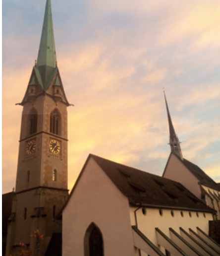
Die Predigerkirche

Mitten im Niederdorf ist die gastfreundliche Predigerkirche seit Jahrzehnten täglich von 10 bis 18 Uhr offen. Neben Feiern, Seelsorge, Konzerten und anderen Anlässen lädt der schöne Kirchenraum auch einfach zum Verweilen ein. Für unsere Besuchenden mit ihren Fragen und Anliegen sind die Freiwilligen des Präsenzdienstes da. Zur Verstärkung des Teams suchen wir Ihr Engagement für möglichst regelmässige 1 bis 2 wöchentliche Einsätze von 2,5 Stunden. Wenn Sie Lust und Zeit haben, den unterschiedlichsten Menschen aufmerksam zu begegnen, dann melden Sie sich bei uns. Möglichkeiten zu Weiterbildung und Austausch im Team sind vorhanden. Wir freuen uns, Sie kennen zu lernen!