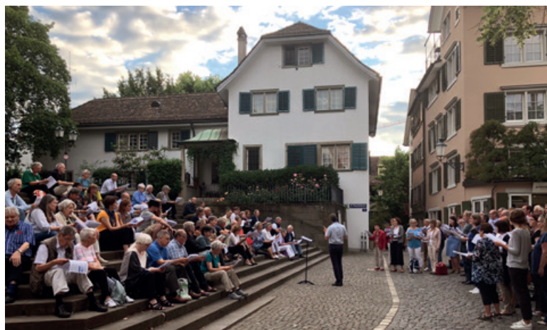
Offenes Sommersingen