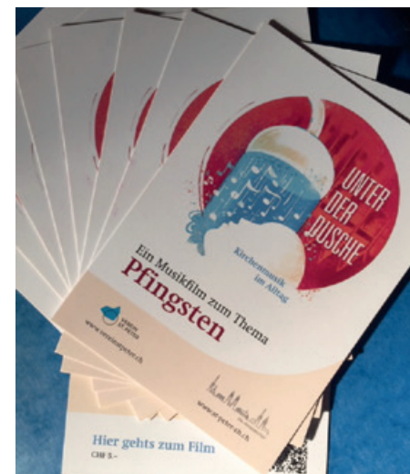
Musikfilm Karten.