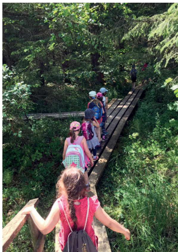
Religionsunterricht – Der Ausflug in den Sihlwald ist eines der vielen eindrücklichen Erlebnisse