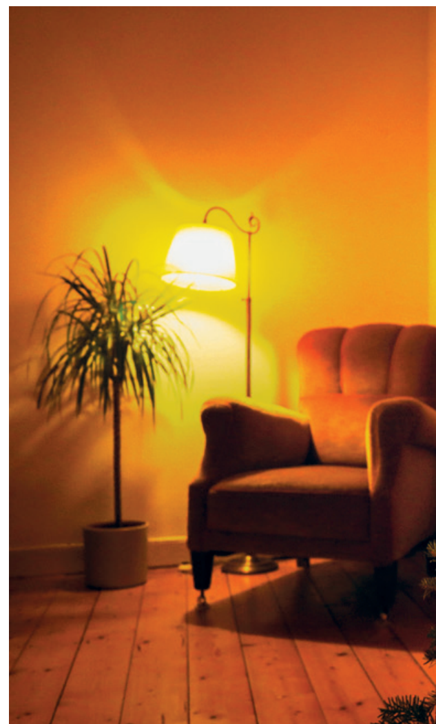
Wir feiern dieses Jahr Weihnachten etwas anders als gedacht.