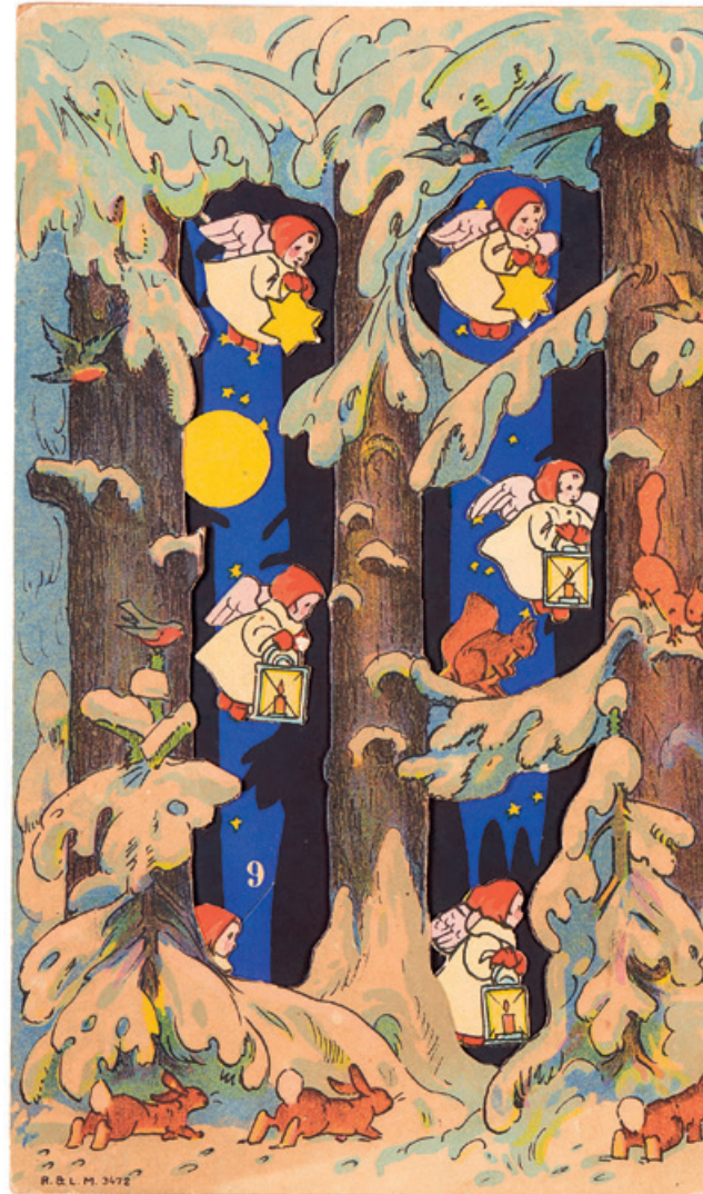
Dieser Adventskalender und viele mehr sind noch bis zum 10.

Das aktuellste Programm finden Sie online oder erfahren es telefonisch bei Ihrem Kirchenkreis.