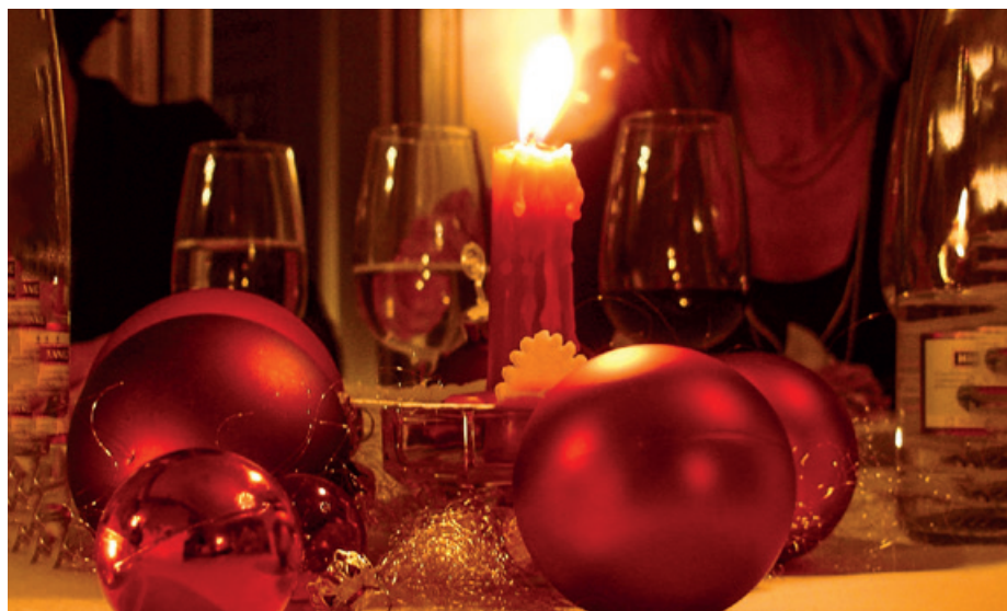
Gemeinsam Weihnachten feiern.

Wir laden Sie zu einer gemeinsamen Weihnachtsfeier auf dem Chilehügel in Altstetten ein. Sie und Ihre Freunde, Bekannten und Verwandten sind herzlich willkommen.