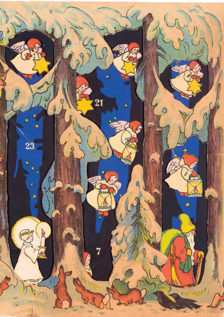
Januar im Landesmuseum Zürich zu bestaunen.

Ausstellung «Weihnachten & Krippen» ergänzt durch historische Adventskalender. Bis 10. Januar 2021