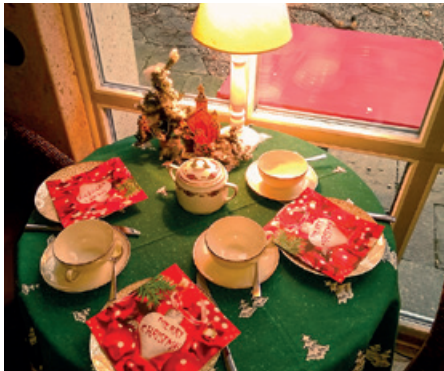
Das Bistro im Kirchgemeindehaus Balgrist ist jeden Wochentag geöffnet, festlich dekoriert und steht allen offen.

Die Pandemie birgt viele Unsicherheiten und erschwert das Beisammensein, den Kern von Weihnachten. Die Kirchenkreise arbeiten mit Hochdruck an Lösungen. Zum Beispiel in der Kirche Balgrist.